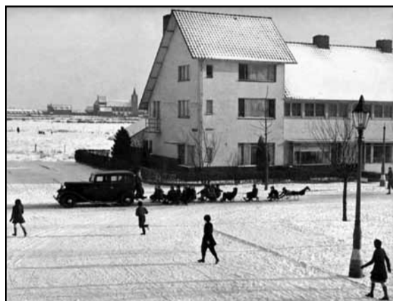
• Sleetje rijden in 1948 in het Witte Dorp, waarachter de 'bewoonde wereld' toen ophield.

randje eronder. Ik zie me nog knippen aan die lange heg. En de trap in ons huis zou ik zo met mijn ogen dicht op kunnen lopen." De bloemen die ze 's winters zag, kwamen niet uit hun tuin: "Boven was er bij ons, met uitzondering van één kamer, geen verwarming. Op mijn slaapkamer stonden de ijsbloemen vaak op de ramen. Beneden stond de kolenkachel. Als die brandde, gingen de schuifdeuren dicht om de warmte zoveel mogelijk te benutten."