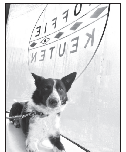
• Koffie Keuten, een mooie ontmoetingsplek.

Het was laveren tussen nog lopende horeca-opdrachten en de agenda van drukbezette vaklui. "Dus het was een spannende eindspurt, voordat ik hier op 25 januari mijn deuren kon openen. De eerste week was het meteen gas erop en was het bikkelen, maar zag ik ook hoe mijn droom er in het echt uitziet", glundert ze.